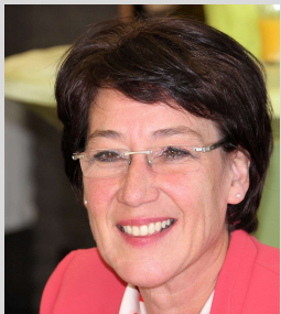
Leen Haesaert Creative and Innovative Business